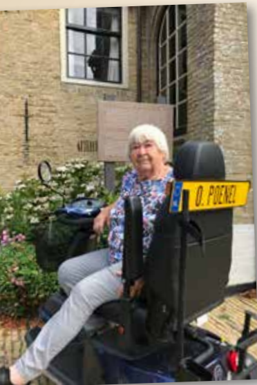
O. Poenel voor de Nicolaaskerk.