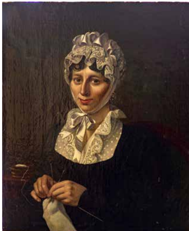
Onbekende kunstenaar, Oud-Hollandse Vrouw, ongedateerd. Olieverf op paneel, 67 x 50 cm.

“Tot de verschrikkingen in het kamp behoorden de dagelijkse appels, waarbij we