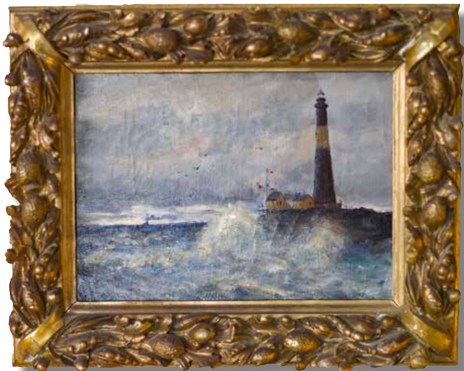
Betzy Akersloot-Berg, Storm bij een Vuurtoren , ongedateerd. Olieverf op doek, 23 x 32 cm.

hun veiligheid naar de rimboe, het bos ten noorden van de kampen, tegen de Sumatraanse kust aan. “Daar hebben we een hele tijd gezeten - ik heb het idee van drie jaar, maar dat kan natuurlijk nooit, zo lang - het was betrekkelijk goed. We waren eigen baas en er was eten: overall groeiden gemberplanten, we hadden genoeg eendeneieren en kokosnoten en de Australiërs hadden brandewijn gedropt. Wat denk je dat je daarvan kunt maken? Ik heb mijn leven te danken aan de atoombom en advocaat.”