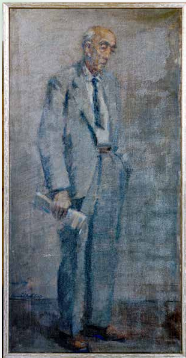
Maurice van Haften, De Oude Man , ongedateerd. Olieverf op doek, 100 x 50 cm.